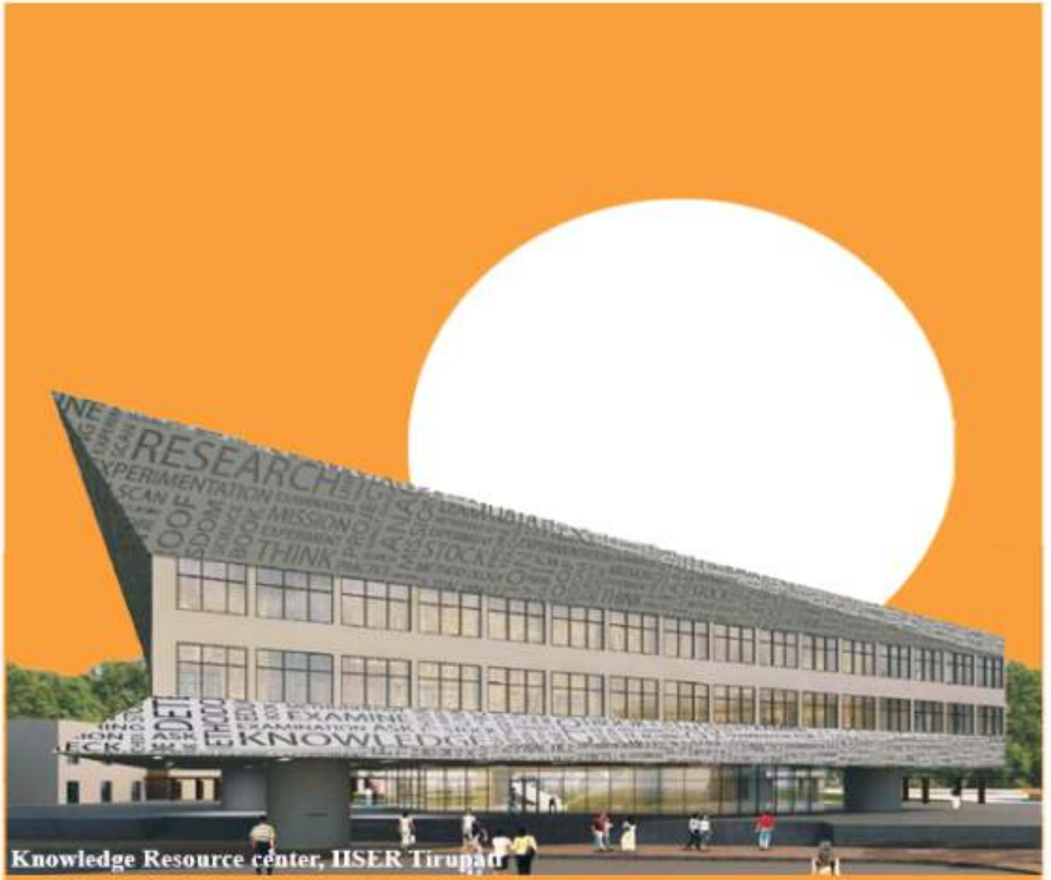
Knowledge Resource center, IISER Tirupati

Incorporating Amendments upto Circular bearing No. DG/CON/340 dt. 21.08.2023